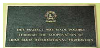
Foto in basso da sinistra: I Lions appendono i labaretti dei loro Club nel Centro - I Bersaglieri in bicicletta durante l'inaugurazione del Centro - Foto di Lions con lo sfondo del Centro - Foto dall'alto del Centro - La targa dedicata al P.D.G. Loizzi. - La targa della L.C. I.F. che ha collaborato al progetto.